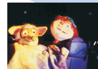
Pupazzi animati a vista.